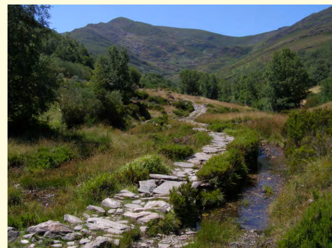
Camiño empedrado no val da Louseira