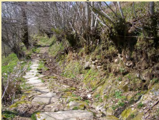
Camiño a Forcadas

O camiño remata e temos que continuar pola estrada, tomando á dereita cara ao río, que atravesamos pola ponte de Requeixo. Uns metros máis adiante tomamos de novo un camiño á dereita que nos devolve á espesura da fraga, que é en realidade a mesma pola que se transitou anteriormente, dividida polo río Grande de Forcadas ou de Bretelo, coa diferenza de que aquí hai castiñeiros. O camiño serpea, e remata aos pés de Forcadas logo de atravesar un pequeno regato por unha ponte lousada e ascender pola ancha e empedrada "costa do Veigueliño", desde a que se ve a airosa silueta da igrexa de Santa María.