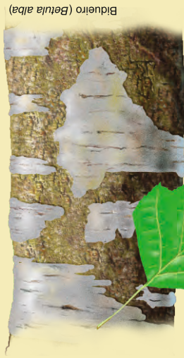
Bidueiro ( Betula alba )