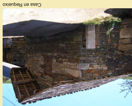
Casa en Requeixo