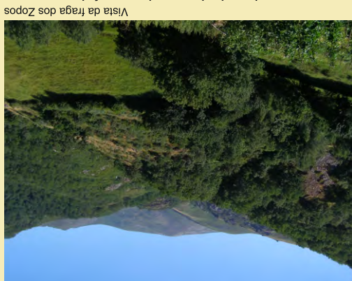
Vista da fraga dos Zopos

O itinerario comeza e remata na aldea de Forcadas. Iniciamos o camiño cara Requeixo na parte alta da aldea xunto a escola. Despois de deixar nogueiras e pradairos, o camiño descende cara o río. Atravesámolo por uns sinxelos pasais ou por unha fermosa ponte lousada, da que só se conservan os sólidos estribos. Inmediatamente o camiño entra na fraga "dos Zopos", bosque caducifolio, que conserva a estrutura propia dos bosques marcescentes de rebolos onde non faltan as perleiras bravas, utilizadas para enxertar as escasas pero saborosas froiteiras de Queixa. Este bosque foi aterrado mediante muros centenarios, construídos con bloques de pequeno campo morrenico no que se asenta, para conseguir a súa conservación mediante a máxima protección do solo fronte á acción das chuvias e as fortes pendentes xa que se trata dun elemento estratéxico na economía local, pois fornece de madeira, leña e landras.