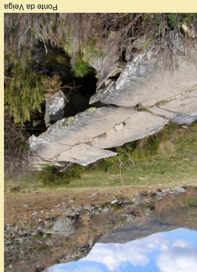
Ponte da Veiga

plás amosa a importancia da lugar. Xa na primeira casa apreazamos aspectos singulares da arquitectura de montaña, como os beirados prolongados construídos para protexer da neve a rúa e a entrada á casa. Atravesamos a aldea e xusto antes de chegar ao cemiterio, podemos ver unha pequena casa pegada ao valo que alberga un dos moitos teares que funcionaban na aldea e que lle deron xusta fama aos seus tecidos. O itinerario continúa pola estrada, pasando polo miradouro do Pito, onde paga a pena parar para contemplar os catro grandes vales Ao continuar descendendo a paisaxe da alta serra é substituída pola vista de Forcadas, inverosimilmente suxeita ás abas da serra, rodeada de prados e reboleras. Polo leste destaca a descarnada aba das minas de wolfram. Abandonamos a estrada por un camiño que sae a man dereita que baixa pronunciadamente e nos interna na fraga de Bidual que nos