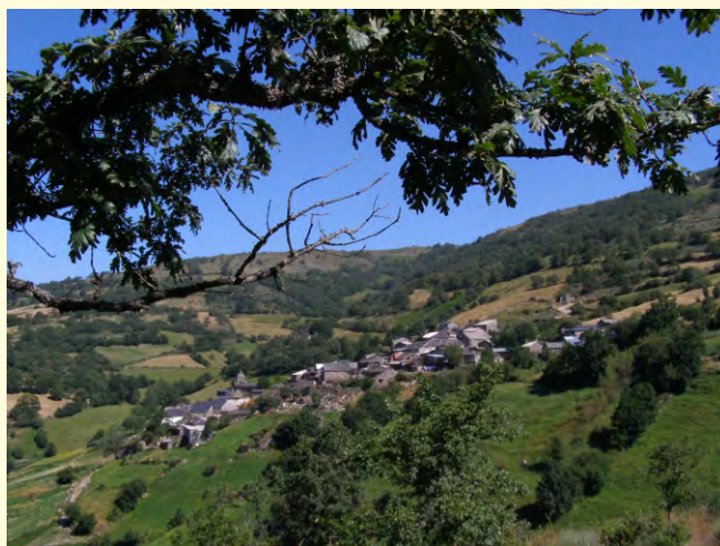
As casas de Forcadas empoléiranse sobre a aba da serra