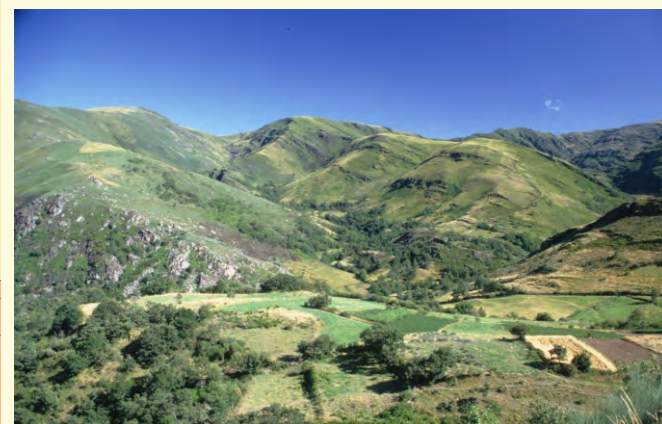
De norte a sur sucédense os vales da Pena, A Cunca, Sullias e Louseira. Na actualidade o xeo foi substituído por corgas que corren polo fondo dos vales.