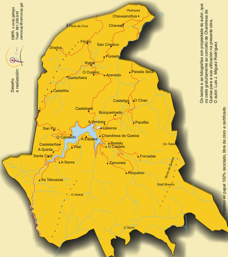
Diseño e realización: cem, s. coop. gallega. Telef: 981 265 640. cemcoop@cemcoop.gal

pedreira do Cacareiro, Polo de orixe periglacial. Polo camiño van aparecendo centauras e especies de altura como a xanzá azul e a herba da papeira, tan utilizada para mitigar as dores dos golpes e para reducir croques e inchazóns. O camiño dirixese agora cara o espazo val da Veiga, que era a canle que desde o Seixo recolla o xeo dos unha pequena ponte lousada. Uns metros máis alá unha nova ponte permite atravesar o río de Aguadalta, que trae as augas do val da Louseira e que serve para mover un muíño arrimado á ponte que dá paso á subida a Requeixo. Atravesada a ponte, dirixímonos á esquerda, e nos internamos uns metros no estreito corredor do río Aguadalta. Antes de atravesalo empata cun fermoso e ben empedrado camiño que chega pola esquerda. Para continuar tomamos cara a Requeixo pola Costa da Veiga, un camiño desde o que se contemplan os vales glaciares máis próximos. Entramos en Requeixo polo recén recuperado forno comunal, e fonte que coas súas