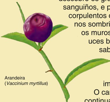
Arandeira ( Vaccinium myrtillus )

descobre os grandes rebolos, bidueiros, sanguíños, e pradairos. Tamén vellos e corpulentos carballos e os cancereixos e nos sombrizos, os couselos abrazando os muros cubertos de brións. As uces brancas, as madreseivas, os saborosos arandos, os grandes fieitos e as silvas transforman a paisaxe nunha "selva", impracticable fóra do carreiro.