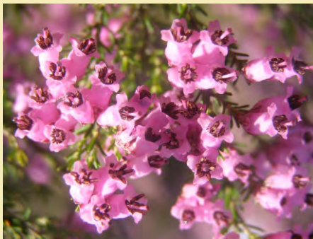
Queiroga ( Erica australis )